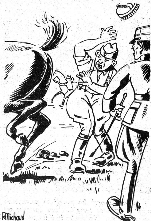
Un fichu dragon.

Le lieutenant: Vous n'avez donc jamais soigné de chevaux, à la maison?