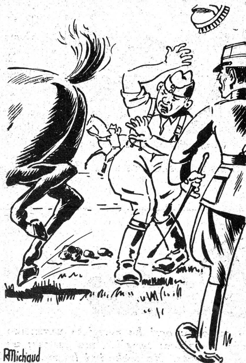
Un fichu dragon.

Le lieutenant: Vous n'avez donc jamais soigné de chevaux, à la maison?