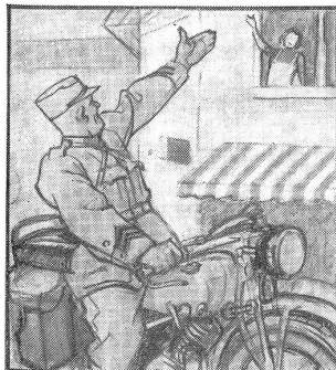
Die beiden kennen sich noch nicht lang — aber es hat doch einen ausführlichen Abschied gegeben, als er einrückte.