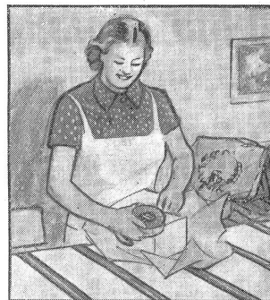
„Von jedem etwas. Und dazu eine grosse Schachtel Gaba, die ist wieso recht.“