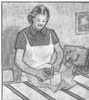
„Von jedem etwas. Und dazu eine grosse Schachtel Gaba, die ist wieso recht.“