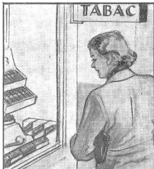
Gleich am nächsten Sonntag soll er ein Päckli haben. „Wenn ich nur wüsste, was er mag: Cigaretten, Stumpen oder Tabak?“