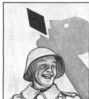
Er lüsst sich halt immer Gaba von daheim schicken, denn er weiss: Gaba hült die Stimme klar.