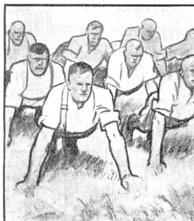
Aber auf's Morgenturnen freut sich die ganze Kompagnie; bei dem guten Kommando klappt es ausgezeichnet.