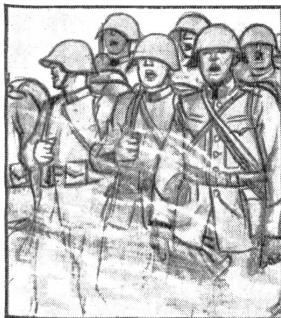
„Was tschumpelt im Kaput dahär Bi Sunneschy und Schnee? Das sind die Füsiliere Mit ihrem L. M. G.“

Sciarade: I. Svitto; II. Lemano; III. Cervino. Indovinello: Brissago.