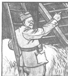
„Da hat's ja Löcher im Dach! Hat keiner ein paar Schindeln im Sack?“