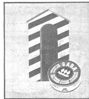
Gaba nehmen — Gaba nützt, Gaba schicken — Gaba schützt.