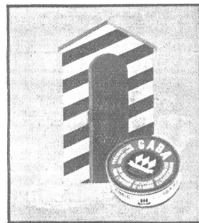
Gaba nehmen — Gaba nützt, Gaba schicken — Gaba schützt.