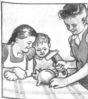
Die Kinder zerklopfen ihren Sparhafen, um dem Vater ein Geburtstagspaket an die Grenze zu schicken.

1. Feb. 1871 Übertritt der Bourbaki-Armee auf Schweizergebiet.