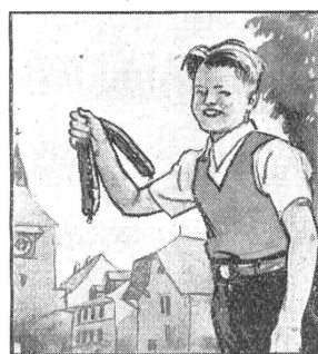
Der Heini holt ein Paar Landjäger, die längsten, die er finden kann, die isst der Vater gern.