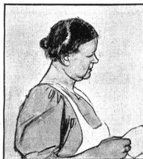
„Ach, wenn er nur keinen Husten kriegt bei dem Wetter ... und das viele Rauchen tut ihm auch gar nicht gut.“