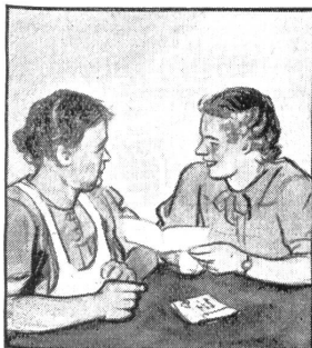
„Warum sind Sie denn so ängstlich, der Bub schreibt doch ganz vernünftig von der Grenze. Er bittet halt um Zigaretten, wie alle.“