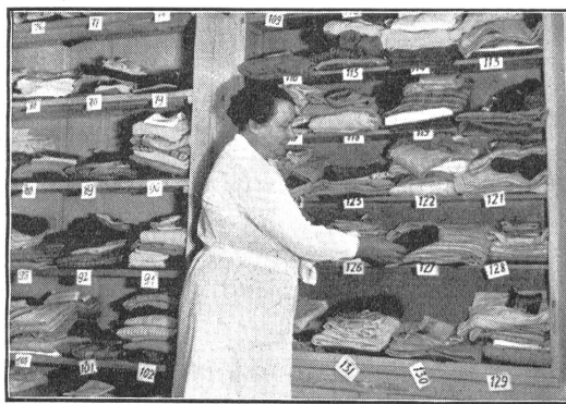
Fein säuberlich geordnet harren die Wäschestücke der Rücksendung an dankbare Soldaten.