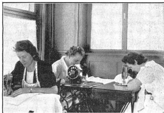
Hilfsbereite Hände an der Arbeit.

Anfangs der Woche trifft jeweils die neue Ladung schmutziger Wäsche ein, wird in den Kellerraum entleert und registriert, und wandert dann schleunigst in eine moderne Wäscherei, in der das Wäschezeug gründlich gereinigt wird. Mit dem Soldatenauto kommt es in hochgefüllten Waschkörben wieder zurück, und jetzt herrscht eigentlicher Hochbetrieb. Es geht ans «Hauptverlesen». Was einwandfrei, wandert sogleich ins nummerierte Fach der großen Tablare, der Hauptteil aber be-