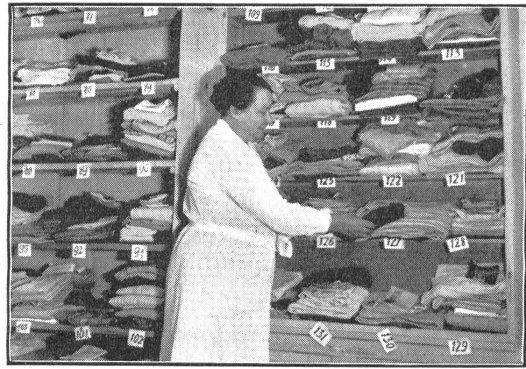
Fein säuberlich geordnet harren die Wäschestücke der Rücksendung an dankbare Soldaten.