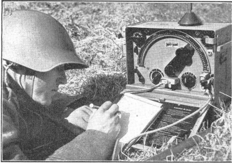
Die Frontplatte des Patrouillen-Sende- und Empfangsgerätes mit den verschiedenen Schaltern für Telephonie und Telegraphie, Senden und Empfang, sowie der Frequenzskala. (Zeitsur-Nr. A Er 553.) Appareil de radio P. émetteur et récepteur. Plaque frontale avec les commandes, commutateur émission-réception, interrupteur pour téléphonie et télégraphie, accords d'antenne et de réception, échelles des fréquences. Sur l'appareil: l'antenne. Il quadrante dell'apparecchio radiotelefonico e trasmettente con i diversi commutatori per il telefono e per il telegrafo, per ricevere e trasmettere, nonché la scala di frequenza.