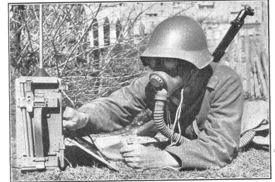
Auch das Gas kann die Übermittlung nicht stören, dank dem Kehlkopf-mikrofon kann auch unter der Gasmaske gesprochen werden. (A Er 551.) Les gaz de combat ne sauraient arrêter le travail du radiotéléphoniste; grâce à son microphone de larynx il peut continuer à converser malgré le masque. Il gas non disturba l'emissione radiotelefonica grazie al laringomicrofono che permette di parlare anche sotto la maschera antigas.