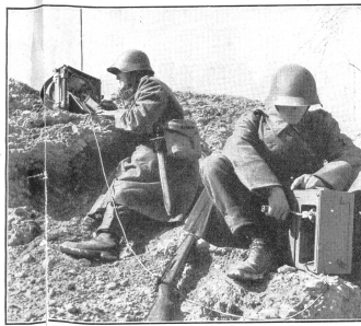
Ist der Apparat in Stellung, so wird der nötige Strom in einem kleinen Handgenerator erzeugt. Dadurch werden die Batterien geschont und das Gerät nachschubfrei. (A Er 552.) Une petite dynamo à main fournit le courant lorsque l'appareil est en position. Grâce à ce générateur on économise la batterie, rendant ainsi le poste indépendant de tout ravitaillement. Quando l'apparecchio è in posizione, si produce l'energia necessaria mediante un generatore a mano. Si può così risparmiare le batterie e rendere l'apparecchio indipendente dal rifornimento.