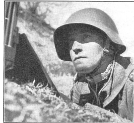
Das Kehlkopfmikrofon, welches die Stimmbandschwingungen aufnimmt, macht die Telephonie-Übertragung gegen jeden Gefechtslärm unempfindlich. (A Er 557.) Grâce au laryngophone, petit microphone attaché autour du cou et enregistrant les vibrations des cordes vocales, les bruits assourdissants du champ de bataille ne troublent pas l'émission comme ce serait le cas avec un microphone ordinaire placé devant la bouche. Il laringomicrofono che raccoglie le modulazioni della voce, fa sì che le emissioni telefoniche restino insensibili anche al frastuono del combattimento.