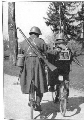
Sogar auf Rad oder auf Ski bleibt der Infanterie-Funker ständig mit seiner Gegenstation in Verbindung. (A Er 555.)

Patrouille radiotéléphonique camouflée derrière un rocher. Pour améliorer l'émission on a fait usage d'une télé-antenne placée au sommet. (A Er 556.) Posto radio mascherato dietro roccia. Per migliorare la trasmissione è talvolta opportuno drizzare l'apposita antenna di lontananza.