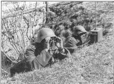
Von vorgeschobenen Beobachtern kann über das P-Gerät den Vorgesetzten laufend über die durch den Feldstecher festgestellten Feindbewegungen gemeldet werden. (A Er 554.)

Un observateur avancé communique directement à son supérieur les mouvements ennemis observés à l'aide de ses jumelles. Dai posti d'osservazione avanzati è possibile tenere i superiori costantemente informati sulle mosse del nemico.