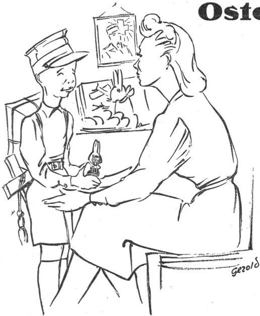
„Worum brieggisch denn Hansli?“ - „I ha gmeint I chöm' e schoggoladige General über, stoff so neme Has.“