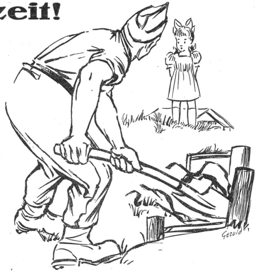
„Soldat, tuesch du Oschterelli sueche?“