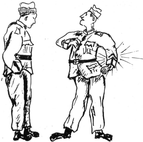
PRIMA E DOPO.

NUOVO ACCANTONAMENTO. Una compagnia di soldati arriva in un villaggio, sconosciuto fin'allora alla più parte.