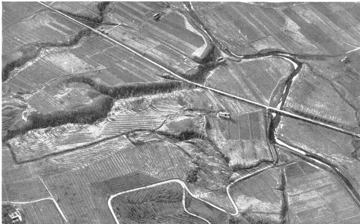
So deutlich sind dem Flieger noch aus Höhen von 2000 und mehr Meter die Details des Kampfgebietes erkennbar.

Es war in der Schlacht um Teruel. Ein republikanisches Rekrutenbataillon, als Eingreiftruppe bestimmt, marschierte in Viererkolonnen an die Front. Das Ziel war noch ein gutes Dutzend Kilometer entfernt. Es herrschte strahlendes Sonnenwetter. Da entdeckte ein nationalistischer Jagdflieger