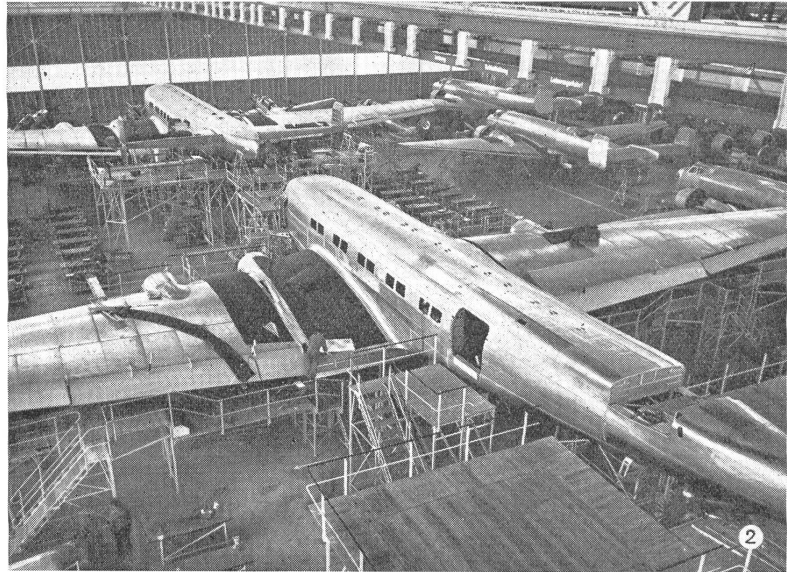
Serienfabrikation der Junkers Ju 90. Es ist ein freitragender Tiefdecker aus Metall, ausgerüstet mit vier Motoren. Er kann sowohl im Frieden als Verkehrsflugzeug wie im Krieg als Truppentransporter verwendet werden.

neues viermotoriges Großraumflugzeug, die Ju 90, entwickelt, bei dessen konstruktivem Aufbau die vieljährigen Erfahrungen in der Herstellung von Ganzmetallflugzeugen verwertet werden. Die Ju 90 ist ein frei-