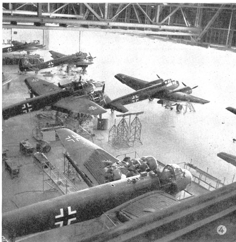
Eine Serie der bekannten Zerstörer und Leichtbomber Junkers 88 verläßt die Halle, um eingeflogen zu werden. Bei den Abnahmevlügen sind ganz bestimmte Flugleistungen zu erfüllen. Nach der letzten — der sogenannten Fertigkontrolle — gelangen die Maschinen zum Einsatz, um die Ausfälle und den Abgang, sowie reparaturfähige Maschinen zu ersetzen.

Nicht nur bei Materialtransporten, sondern auch bei Umgruppierungen innerhalb der kämpfenden Truppe konnten die Ju 52 und Ju 90 ihr großes Fassungsvermögen und ihre unübertroffene Sicherheit unter Beweis stellen. In einem Falle wurde mit Ju-