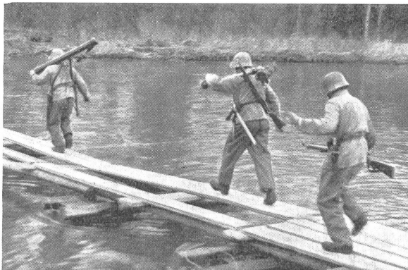
Ueber den schwankenden Steg hetzen nun die beiden Minenwerfer-Züge. (VI Br 8541.)