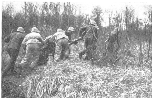
Die Gruppen jagen auseinander und bringen die Geschütze in Feuerstellung. (VI Br 8547.)

zum Waldrand, bereit zum endgültigen Brückenschlag, den die Mw.-Kanoniere vom 2. Zug ausführen werden. Die Jk.-Männer pirschen zu ihren Geschützen.