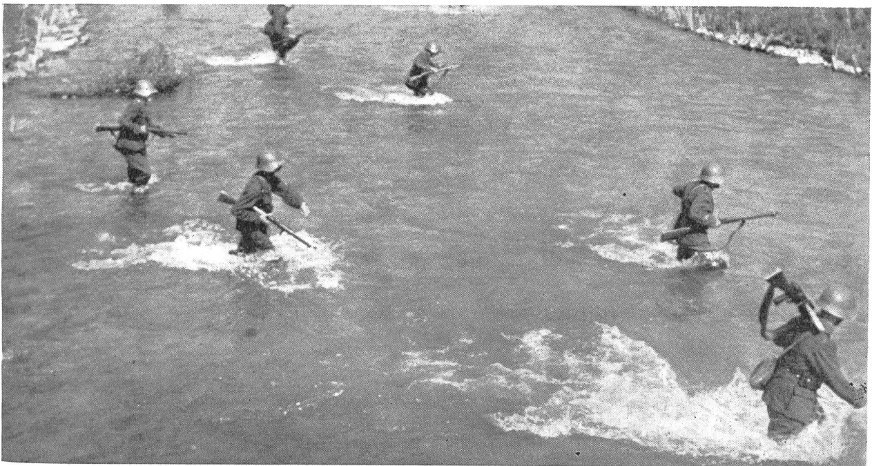
Für den Infanteristen gibt es keine Hindernisse. (Zensur-Nr. VI B 2394.)

Jeder Mann nimmt sich einen bestimmten Punkt, der sich markant vom Horizont oder aus dem Gelände abhebt, als Richtungsweiser . Diesen Punkt soll er nie aus den Augen verlieren, soll nie von ihm abweichen, denn er bildet das Ende seiner persönlichen Angriffssachse.