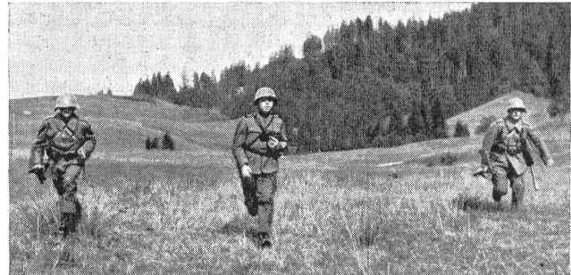
Uniform-Unterschiede zwischen Mannschaft und Offizieren (Bild links) führen schnell zu empfindlichen Verlusten an Offizieren; in Mannschaftsuniform (Bild rechts Mittlmann) wird der Off. nur schwer erkennbar sein. (Zensur-Nr. N/M/7225/26.)