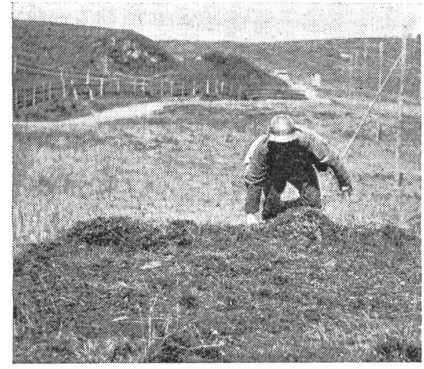
Seitliches Verschieben in der Deckung schützt vor Abschluß beim nächsten Sprung. (Zensur-Nr. N/M/7251/61/66.)