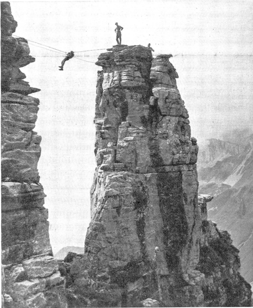
Seilarbeit am Felssturm. — Travail à la corde dans le rocher. — Lavori in corda sulle guglie alpine. (Z.-Nr. VI B 8791.)

Verwendungsart a) konnte im Ernste von den Russen nie angewendet werden. Die wenigen Maschinen, die in Fernflügen von Oesel, Hangö oder Dagoe aus Berlin bzw. die Peripherie Groß-Berlins erreichten und dann in aller Hast und ohne zu zielen sich ihrer Bombenlast entledigten, können wohl kaum als «Hammerschläge» im Sinne der RAF bewertet werden. Ebenso wenig die Bombardierungen von Constanza und Ploesti. Diese beiden rumänischen Städte waren zu nah der Front, als daß sie im strategischen Sinne als feindliches Hinterland gelten konnten. Was es mit den russischen Fallschirmabspringern auf sich hat, die angeblich in Bulgarien abgesetzt wurden, kann noch nicht völlig abgeklärt werden. Sowohl aber das eine wie das andere hat mit einer selbständigen und planmäßigen Vernichtungsaktion der Roten Luftflotte gegen die Lebenszentren des feindlichen Hinterlandes nichts zu tun. Dieser Mißerfolg ist aber keineswegs auf ein Unvermögen der russischen