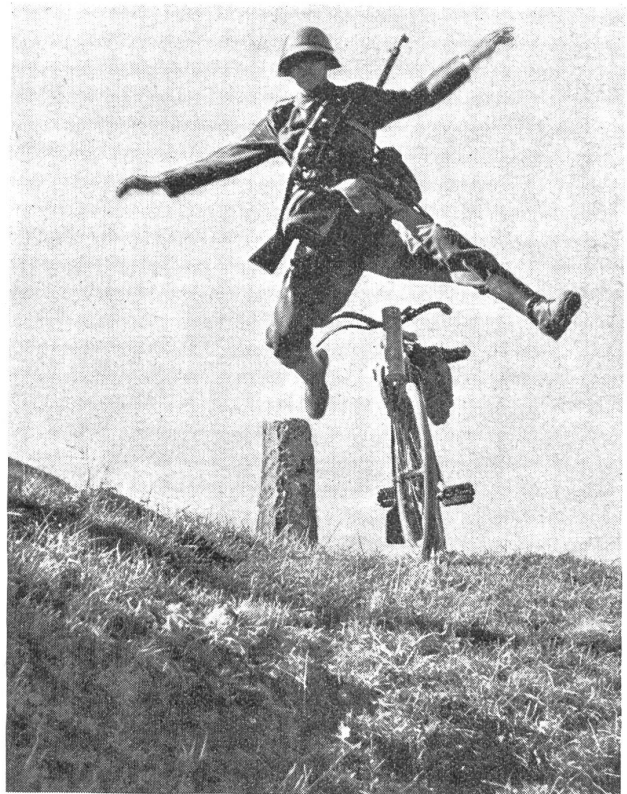
Der Sprung in die Deckung: 2. Phase. — Le bond pour se mettre à couvert: 2 me phase. — Un salto per mettersi al coperto: seconda fase. (Zens.-Nr. N M 7572)