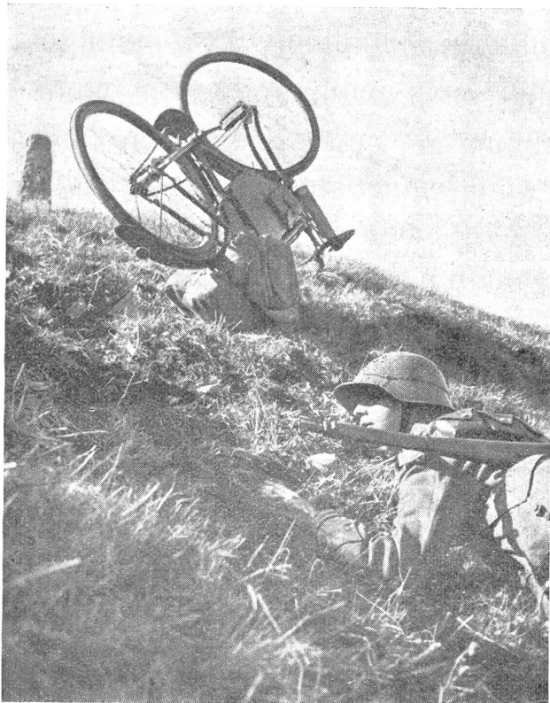
Der Sprung in die Deckung: 4. Phase. — Le bond pour se mettre à couvert: 4 me phase. — Un salto per mettersi al coperto: quarta fase. (Zens.-Nr. N M 7650, Phot. K. Egli, Zürich.)

brauchen zu dürfen, auf schlecht ausgebauten Nebenstraßen: das ist keine so einfache Sache. — Nun sind wir nur noch ein paar Kilometer vom Dorf A entfernt. Jetzt heißt's doppelt vorsichtig sein, denn unser Unternehmen ist für die Kompanie von größter Wichtigkeit. Ein Blick auf das Kroki, das eine Aufklärungspatrouille für uns angefertigt hat, zeigt, daß wenige hundert Meter vor uns eine Brücke liegen muß, bewacht von einem verstärkten feindlichen Unteroffiziersposten. Diese Brücke ist unter allen Umständen unbemerkt zu umgehen. Da rechts zweigt ein Fußweg ab, der durch Wald zum Flusse führt und nach Angaben der Aufklärungspatrouille nicht bewacht ist. Mühsam kämpfen wir uns auf dem schmalen Weglein vorwärts, in das hinein immer wieder Zweige von Brombeersträuchern weit genug ragen, um auf unsern Händen und Gesichtern deutliche Kratzspuren zu hinterlassen. Plötzlich gibt der Boden unter meinen Füßen nach, rücklings falle ich samt Rad in einen tiefen Graben. Meine Gruppe stoppt. Da ... was ist da vorn? Eine Taschenlampe blitzt auf. Wir hören deutlich Stimmen. Feind? Wir bleiben ganz ruhig. Das Licht kommt immer näher. Meine Radfahrer drücken sich in das Dickicht und stellen sich links und rechts des Pfades zum Angriff bereit.