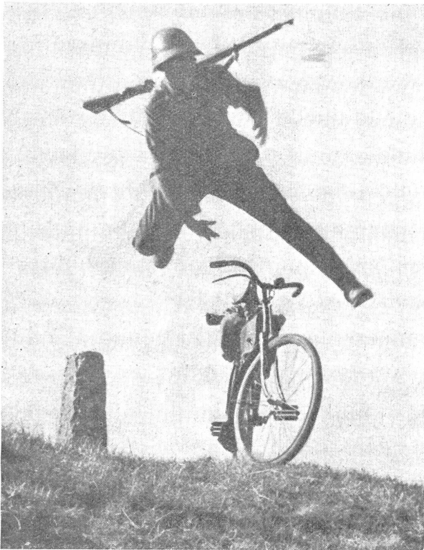
Der Sprung in die Deckung: 3. Phase. — Le bond pour se mettre à couvert: 3 me phase. — Un salto per mettersi al coperto: terza fase. (Zens.-Nr. N M 7573, Phot. K. Egli, Zürich.)