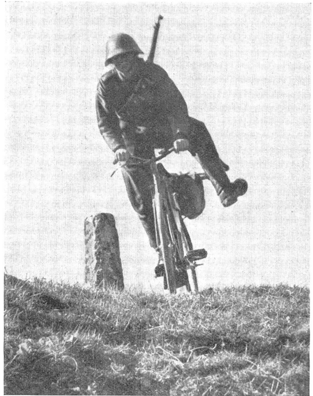
Der Sprung in die Deckung: 1. Phase. — Le bond pour se mettre à couvert: 1 re phase. — Un salto per mettersi al coperto: la prima fase. (Zens.-Nr. N M 7571, Phot. K. Egli, Zürich.)

Bereits fahren wir mehr als eine halbe Stunde. Ueber dem Boden lagert eine dichte Nebelschicht: für unser Unternehmen ein Vorteil und doch ein Nachteil zugleich. Ein Vorteil, weil uns der Feind im Dorf nur auf nächste Distanz erkennen kann, ein Nachteil aber, weil wir den Bereitstellungsraum innerhalb kürzester Zeit erreichen müssen. Bei Nacht und dichtem Nebel, ohne eine Taschenlampe ge-