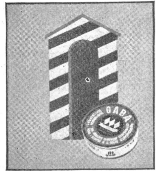
„Mutti, kriegt der Vatti nicht den Husten, wenn's so kalt ist?“ — „Dafür schicken wir ihm Gaba.“