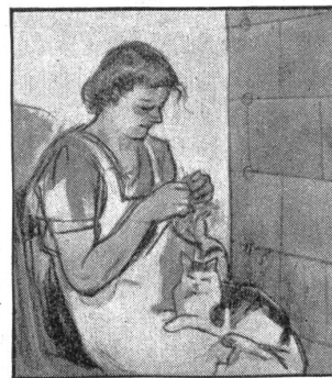
„Mutti, friert der Vatti nicht an den Händen?“ — „Dafür stricke ich ihm die Handschuhe.“