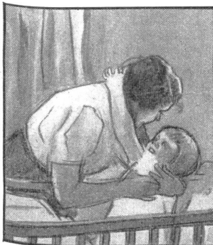
„Mutti, wo ist der Vatti jetzt?“ — „Er steht Wache in den Bergen.“

Gibt es auf der ganzen Welt ein Staatswesen, das einen schöneren Namen trägt als unser Vaterland! Schweizerische Eidgenossenschaft! Niemand kann diesen Namen überdenken, ohne sich des großen Ernstes, der aus ihm spricht, bewußt zu werden. Er erinnert daran, daß die Schweiz aus Bündnen und Schwüren und damit aus der Verpflichtung aller ihrer Glieder zur gegenseitigen Treue entstanden und zu staatlichem Dasein gelangt ist. Die alten Pergamente sind zwar vergilbt und längst durch einen einzigen Bund ersetzt; geblieben ist der ursprüngliche Geist; er sollte jeden, der den Ehrentitel eines Eidgenossen beansprucht, noch heute und gerade heute beseelen. G. Guggenbühl.