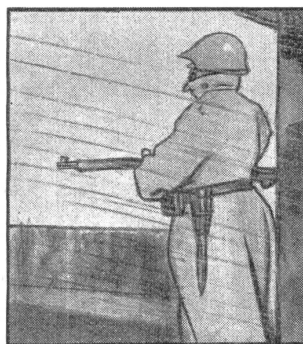
Es ist kein Schleck, denn da zieht's von allen Ecken. Man kriegt leicht „d'r Bälli.“