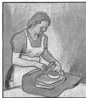
Gut, dass der Bund im Grossen sorgt hat mit dem warmen Mantel und die Mutter im Kleinen sorgt: sie schickt ihm immer Gaba.