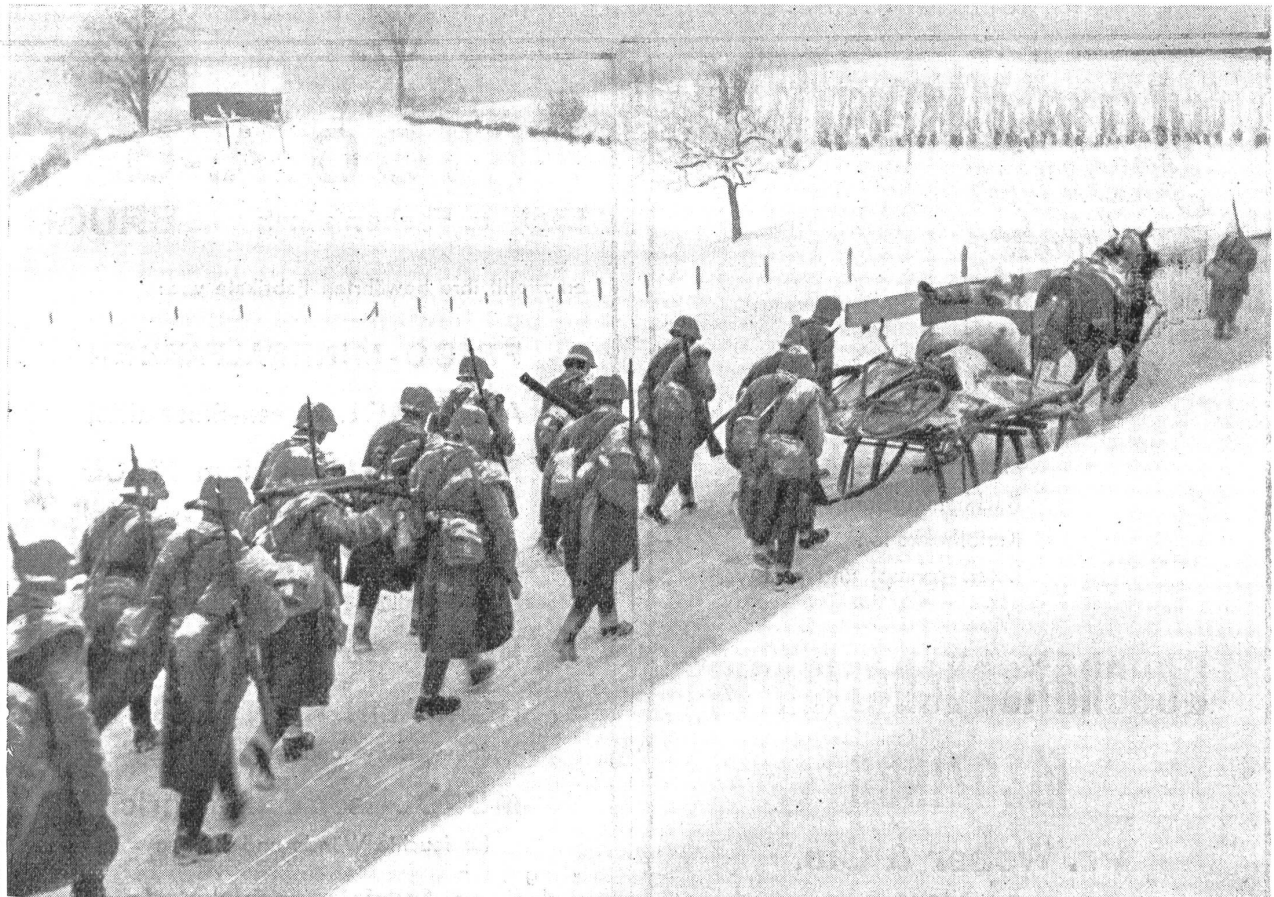
Mühsamer Wintermarsch, Requisitionsschlitten sind an Stelle der Ordonnanzfahrwerke getreten. — Pénible marche d'hiver, les traîneaux réquisitionnés ont remplacé les fourgons d'ordonnance. — Faticosa marcia durante l'inverno. Le slitte requisite sostituiscono i furgoni. (Zens.-Nr. VI Br 823).