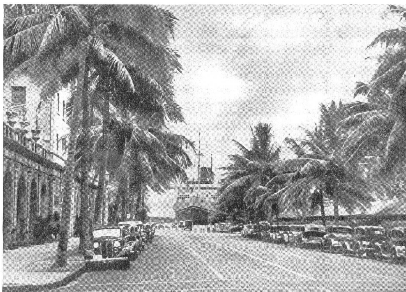
Hauptstraße von Honolulu auf Hawai mit Hafen im Hintergrund. — Route principale de Honolulu à Hawai. A l'arrière-plan: le port. — Strada principale di Honolulu nell'isola di Hawai col porto sullo sfondo.

Hawai wurde 1527, also vor Japan, von den Spaniern entdeckt. 1778 hißte hier der Seefahrer Cook, der die Sandwichinseln zu Ehren seines Gönners Lord Sandwich so nannte, die Union Jack, ohne daß den Eingeborenen ihre politische Souveränität genommen wurde. Der Einfluß der USA machte sich erst seit der Mitte des vorigen Jahrhunderts geltend. Da die auf Hawai niedergelassenen Plantagenbesitzer ein großes Interesse an zollfreier Einfuhr von Zucker in die