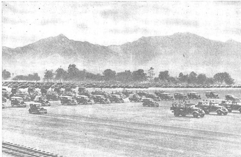
Die motorisierte amerikanische Armee auf Hawai während einer Truppenparade. — L'armée motorisée américaine à Hawai pendant une revue de troupes. — L'armata motorizzata americana nell'isola di Hawai durante una sfilata.

Die Vereinigten Staaten haben den Wert dieser Kolonie längst erkannt und nichts unterlassen, um sie zu einer wertvollen Festung auszubauen. Schon vor Jahren wurde die Zucker- und Ananaskultur stark abgebaut und durch Reis-, Mais- und Gemüsebau ersetzt, um eine weitgehende Selbstversorgung der Inseln zu gewährleisten, so daß die Festung auch einer längeren Blockade standhalten kann.