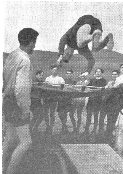
Ueber das Federsprungbrett auf das Sprungtuch. — Saut dans la toile de sauvetage. — Salto sul telo di salvataggio. (Zens.-Nr. N M 8133.)