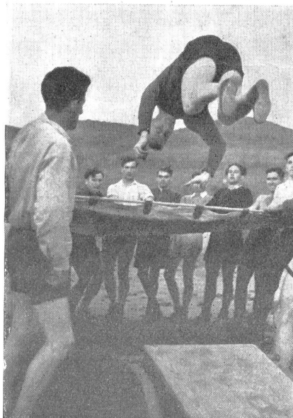
Ueber das Federsprungbrett auf das Sprungtuch. — Saut dans la toile de sauvetage. — Salto sul telo di salvataggio. (Zens.-Nr. N M 8133.)