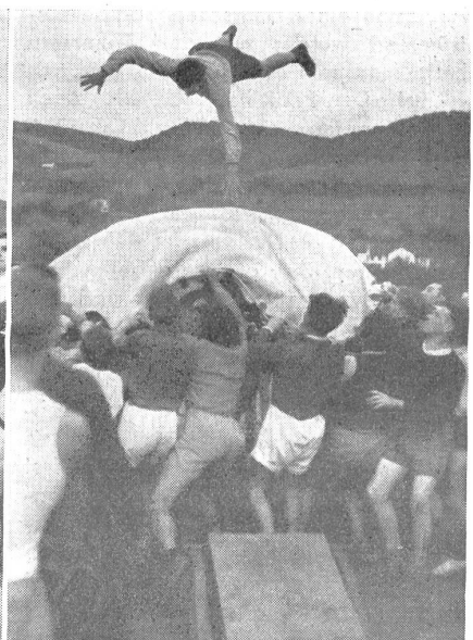
Antritt einer kurzen Luftreise. — Début d'un court voyage aérien. — Inizio di un breve viaggio aereo. (Zens.-Nr. N M 8134.)