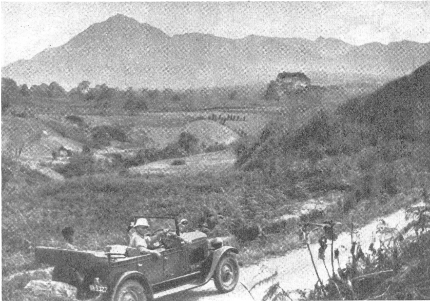
Gajoelandschaft auf Sumatra mit ausgedehnten Reispflanzungen. Im Hintergrund das Massiv des 3000 m hohen Telong. — Plantations de riz à Sumatra. A l'arrière plan le massif de Telong, altitude 3000 m. — Paesaggio gajoese a Sumatra con estese piantagioni di riso. Sullo sfondo il massiccio di 3000 m. del Telong.

Durch den Ausbruch des Krieges im fernen Pacific sind auch die holländischen Kolonien in den Kampf hineingezogen worden. Die wichtigste holländische Kolonialinsel Sumatra liegt mit ihrer Ost- und Nordostküste in unmittelbarer Nachbarschaft des größten englischen Stützpunktes im Osten, der Festung Singapur und dürfte vermutlich über kurz oder lang mit ihrem nördlichen Teil zum engeren Kriegsgebiet zählen.