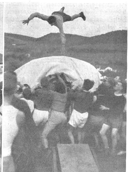
Antritt einer kurzen Luftreise. — Début d'un court voyage aérien. — Inizio di un breve viaggio aereo. (Zens.-Nr. N M 8134.)