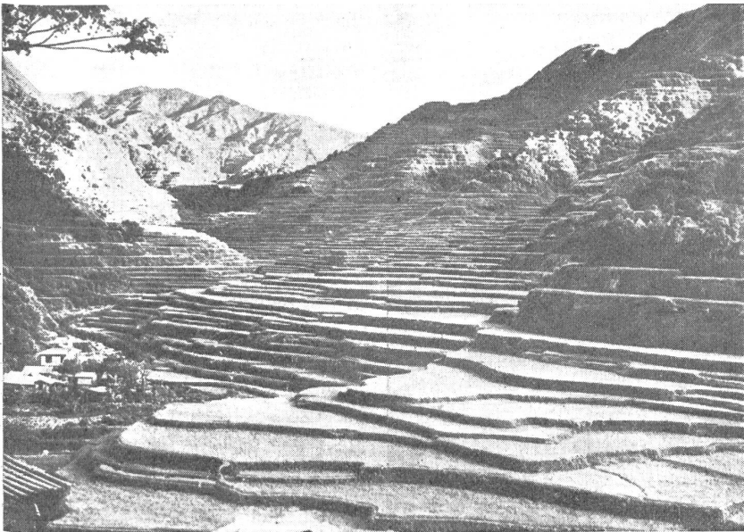
Reisterrassen in den Bergen von Nordluzon. — Rizières en terrasses dans les montagnes au nord de Luçon. — Coltivazioni di riso a terrazze nelle montagne settentrionali dell'isola di Luzon.

Lotterwirtschaft um sich und öffnete der Ausbeutung der einheimischen Bevölkerung Tür und Tor.