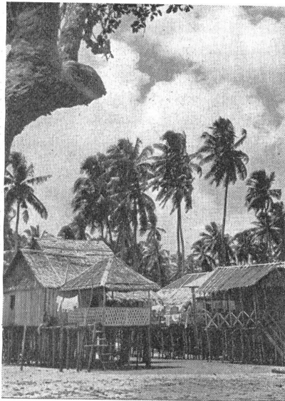
Eingeborenendorf auf den Philippinen. Village indigène dans les Philippines. Villaggio di indigeni nelle Filippine.

Verläßt man im Hafen das Schiff, so gewahrt man, daß sich hinter den Geschäftshäusern das Wahrzeichen der Stadt, die alten Befestigungen, erheben, es sind die Intramuros, die die Altstadt umgeben. Durch die Straßen eilen die Rikschas und überall gewahrt man barocke katholische Kirchen, die aussehen wie die spanischen Kathedralen, auch von Spaniens Kunst und Kultur Zeugnis ablegen. Manila ist die Hauptstadt, von hier aus wird das gesamte Territorium, das etwa achtmal so groß ist wie die Schweiz, und von zirka 16,5 Millionen Menschen besiedelt ist, regiert. Der Archipel ist natürlich eine wertvolle militärische Position der angelsächsischen Mächte hier im Osten und auf dem vulkanischen Boden gedeiht eine üppige Landwirtschaft, die für die Selbstversorgung der Inselgruppe genügen dürfte, so daß sich diese auch im Falle einer Blockade längere Zeit halten können. Flottenstützpunkte und Flugplätze sind auf allen größeren Inseln zu finden. Die Amerikaner hatten hier in Friedenszeiten 25,000 Mann stationiert, etwa 200 Flug-