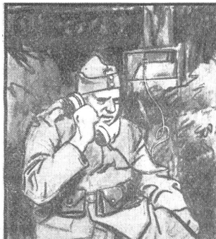
„Dü Poschte isch gar wichtig, wenn's de is Träffe goht. Dass me's Kommando richtig züh Schtunde wit verstoh.“