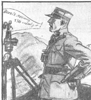
Aber eine klare, starke Stimme gehört immer dazu, beim Telefonieren wie beim Kommandieren.