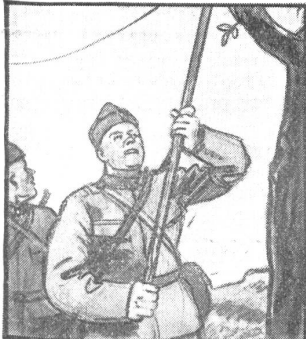
„I alle Regimänte, bi jeder Kompanie, müend dere Sapermente zum telefonje si.“

4984a Alleinportier, Kleinhotel, Lugano, 20. März bis November.