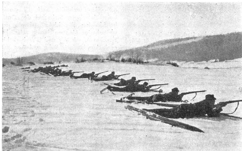
Ebenfalls ein Grenzbesetzungsbild aus dem Jahre 1914: Skifahrende Infanterie im Feuergefecht. — Une vue de l'occupation des frontières en 1914: Infanterie à ski au combat. — Un'altra figura dell'occupazione delle frontiere 1914: fanteria su sci nel fuoco del combattimento.

Neben dieser freiwilligen Tätigkeit sollte aber auch die Ausbildung von Skipatrouillen im Militärdienst selbst ins Auge gefaßt werden. Die Verhältnisse der Milizarmee bieten allerdings einige Schwierigkeiten, doch dürften sich diese ohne wesentliche Kosten überwinden lassen. Es wäre z. B. möglich, in jeder Gebirgsbrigade jeden Winter einen Skikurs abzuhalten, zu dem jede Kompanie eine aus wiederholungskurspflichtigen guten Skiläu-