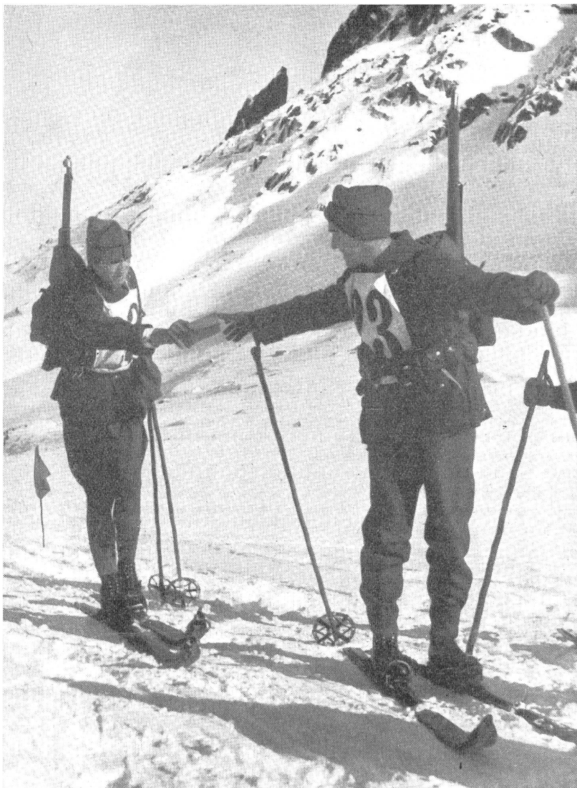
Stafettenwechsel bei einem Militär-Skistafettenlauf im Jahre 1934. — Passage du témoin dans une course militaire d'estafettes à ski. — Cambio di staffetta ad una corsa militare di sci del 1934. — (Z.-Nr. VI Br 9793.)

Sie zeigen uns, daß auch hier größter Willensaufwand nötig ist, um nicht ungenügende Resultate und die dadurch entstehenden Zeitzuschläge ins Hintertreffen zu geraten. Stand in