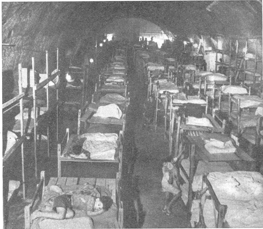
Malta hatte im Laufe eines einzigen Monats 263mal Fliegeralarm; die Bevölkerung lebt fast ausschließlich in den nach Tausenden zählenden, in Felsen eingehauenen Luftschutzräumen. — Malte a eu, pendant un seul mois, 263 alarmes aériennes, de sorte que la population vit presque exclusivement dans les milliers d'abris construits dans les rochers de l'île. — Malta subi in un sol mese di guerra ben 263 allarmi antiaerei. La popolazione vive quasi esclusivamente nei rifugi antiaerei scavati a migliaia nelle rocce dell'isola.

Dies sind neun wichtige Ereignisse des Krieges — einige von entscheidender, andere nur von symptomatischer Bedeutung —, welche die Sphäre des reinen Land- oder Land-Luftkrieges überschreiten und bei denen die See mit ins Bild kommt. Betrachtet man den Gesamtverlauf des Krieges, so zeigt sich, daß die See, außer im polnischen und im ersten Teil des französischen Feldzuges, überall im Blickfeld der Operationen war. In Norwegen, in Holland, in Dänemark, in Griechenland und Kreta, in Syrien und Libyen, in Eritrea und Somaliland, ja auch in Rußland (besonders bei den Flügelverankerungen in Murmansk und am Schwarzen und Asowschen Meer), schließlich ganz entscheidend im Fernen Osten. Wenn daher die Frage nach der richtigen Anwendung der Luftwaffe auch nicht erschöpfend ohne entsprechende Einbeziehung der Landkriegsereignisse beantwortet werden kann, so betreffen doch die vorgeführten Beispiele schon einen so wichtigen und großen Ausschnitt des Gesamtkrieges, daß die Lehren, die daraus gezogen werden können, bedeutsam genug sein müssen. Diese Lehren aber drängen sich gerade aus den vorliegenden Beispielen