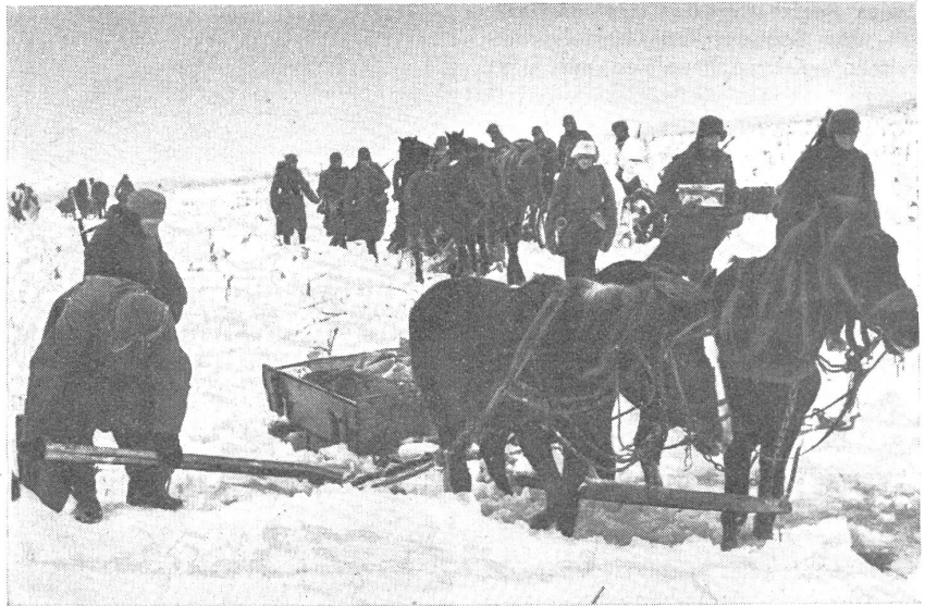
Bereitstellung von Schlitten an der Ostfront für den Mannschaftstransport. — Préparation de traîneaux sur le front de l'Est pour le transport des troupes. — Approntamento di slitte sul fronte orientale per il trasporto di truppa.