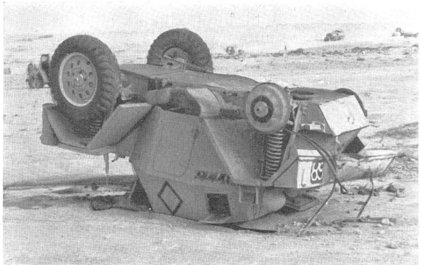
Wirkung einer Tankmine auf einen leichten Panzer-Aufklärungswagen. — Effet d'une mine anticar sur un char léger d'exploration. — Effetto di una mina anticarro su un carro armato leggero da ricognizione.

Deutscher Minensuchtrupp in Frankreich an der Arbeit während des Feldzuges 1940; der Mann rechts trägt eine ausgegrabene und gesicherte französische Tellermine. — Equipe allemande de détecteurs de mines au travail en France pendant la campagne de 1940; l'homme de droite porte une mine française qui vient d'être déterrée et assurée. — Squadra tedesca cercamine in Francia al lavoro durante la campagna 1940; l'uomo a destra porta una mina francese levata dal suolo e assicurata.