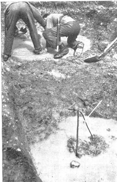
Einbau von bedienten Minen mit Zündschnurzündung. — Installation de mines avec cordons d'allumage. — Applicazione di micce d'accensione a mine pronte. (Zens.-Nr. VI R 10168.)

Die heute verwendeten selbsttätigen Minen sind meist direkte Kontaktminen . Die einfachste Art besteht aus einer Trotyl-Sprengpatrone mit Sprengkapsel und Schlagzünder. Dabei ist am Schlagzünder ein Draht so befestigt, daß derselbe durch den Feind ungewollt gestreckt wird, wodurch der Mechanismus des Schlagzünders in Funktion tritt und die Mine zur Explosion bringt. Diese Minen werden oft in Verbindung mit Stolperdrähten oder Drahtschlingen verwendet. Durch Berührung und Streckung der Drähte wird dabei die Mine zur Explosion gebracht. Auch Handgranaten können für diese einfachste Art von Kontaktminen verwen-