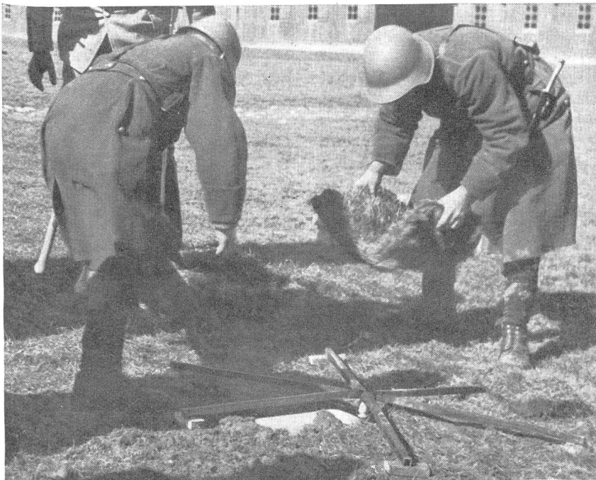
Auslegen von Tankminen mit Druckstern. — Pose de mines antichar. — Posa di mine a stella. (Zensur-Nr. VI R 10170.)

oder ein geländegängiges Fahrzeug über eine solche Bleikappe, so verbiegt sie sich, wobei der Glasbehälter zerbricht und die Säure ausfließt. Diese erzeugt mit dem Zinkkohleelement einen galvanischen Strom, der einen elektrischen Zünder zur Detonation und die Mine zur Explosion bringt.