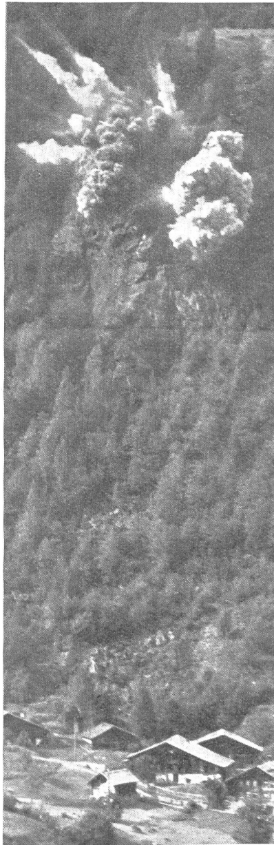
Explosion einer bedienten Mine. — Explosion d'une mine. — Esplosione di una mina.

Hauptsache ein Stellungskrieg war, den Kampf mit unterirdischen Minen gegen befestigte Stellungen, denen nicht anders beizukommen war, verstand, hat heute, im Zeitalter des Bewegungskrieges auch der Minenkrieg seine Bedeutung geändert, und sich der raschen Bewegung angepaßt. Die tief unter dem Boden liegenden Minen haben den nur knapp unter Erdoberfläche liegenden Minen Platz gemacht. Für die früheren unterirdischen Minen , die die Zerstörung der feindlichen Stellung bezweckten, mußten oft sehr lange Minengänge gebaut werden, bis die Ladung angebracht und nach sehr starker Verdämmung zur Explosion gebracht werden konnte. Vom Gegner wurden, um das Anbringen der Minen zu verhindern, Gegenstollen vorgetrieben, die ihm das Abhören der feindlichen Arbeit und das Anbringen von Gegenminen zum Abquetschen der Minengänge gestatteten. Dieser Kampf unter der Erde wurde im letzten Weltkrieg, nach Erstarrung der Fronten, auf kilometerlangen Geländeabschnitten geführt. Meist dauerte es dabei Monate bis ein Minengang fertig erstellt und der Sprengstoff zur Explosion gebracht werden konnte.