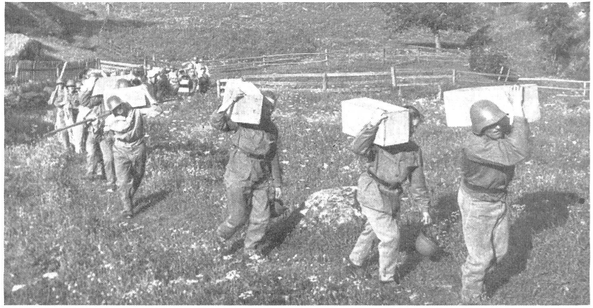
Mineure beim Sprengmaterialtransport. — Mineurs transportant du matériel de mines. — Minatori al trasporto di materiale esplosivo. (Zensur-Nr. VI R 10169.)

det werden. Ihr Mechanismus ist dabei so einzustellen, daß er vom Feinde ungewollt (Druck, Zug) ausgelöst wird.