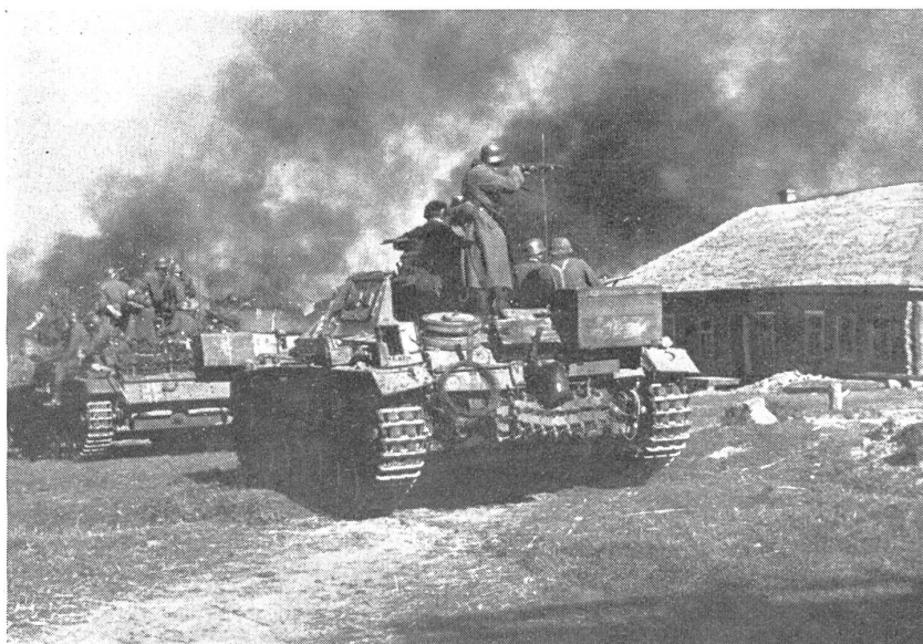
Der kombinierte Panzerwagen-, Spreng- und Stoßtrupp im Vormarsch. — Marche d'un détachement combiné: tank, équipes de destruction et de choc. — Reparto combinato di carri armati, di guastatori e di truppe d'assalto in marcia.

Gegen 3 Uhr morgens flackert das Artilleriefeuer wieder auf und streut das Gelände ab. Die Soldaten liegen in ihren