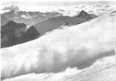
Rechtzeitiges Erkennen und Vermeiden der alpinen Gefahren und die Eignung, diese Gefahren auch überwinden zu können, gehört mit zu den Fähigkeiten, die der Gebirgsdienst von den Führern aller Grade fordert. Bild: Abbruch einer Eislawina über eine wichtige Aufstiegsroute. — Savoir déceler et éviter à temps les dangers alpins, au besoin même les surmonter, fait partie des qualités que doivent posséder les chefs de tous grades appelés à servir en haute montagne. Cliché: Déclenchement d'une avalanche sur une voie d'ascension importante. — Fra le qualità che un capo di ogni grado deve possedere per il servizio in montagna, vi è anche quella di saper riconoscere ed evitare per tempo i pericoli alpini, e di saperli sommontare. Figura: Rottura di una valanga di ghiaccio su una salita importante. (Z.-Nr. VI Br 4947.)