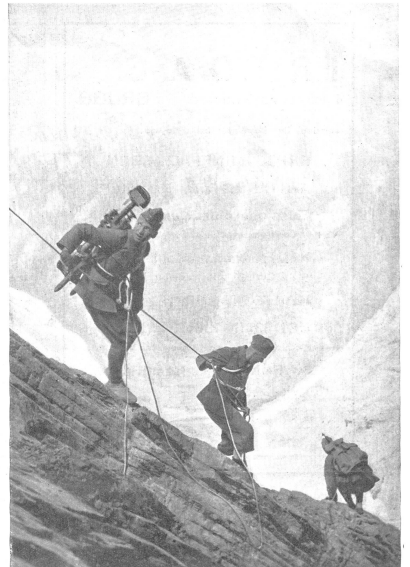
Wo es hinaufging, muß es auch einen Abstieg geben. — Partout où l'on monte, il faut aussi pouvoir descendre. — Dopo la salita, ... la discesa. (Z.-Nr. VI Br 4944.)