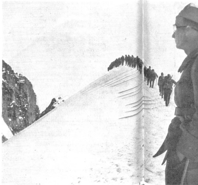
Übungsmärsch über eine Firnkette: je schmaler die Spalten, desto größer die Marschdisziplin und um so schwerer wird es der feindlichen Luft zu trotzen. — Exercice de marche sur une arête: plus la trace est étroite, plus la discipline de marche est grande, et d'autant plus sera-t-il difficile à l'observation aérienne de tracer ces traces dans la neige des conclusions quant à l'effectif de la troupe. — Esercizio di marcia su una cresta: più stretta è la pista, meglio dev'essere la disciplina di marcia e più difficile anche sottrarsi alla vista del nemico. (Z.-Nr. VI Br 4947.)