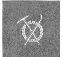
In Härte erworben — mit Stolz getragen. — Acquis durement — fièrement porté. — Guedegnato con dure fatica — portato con fierezza.