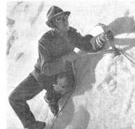
Sichern im Fimhang: gespannt und wachsam Augen wird des Vorrücken des Seilkameraden verfolgt. — La montée du camarade de cordée sur le névé fortement incliné est assurée et suivie avec attention. — Sicurezza nel pendio verso la cima: l'occhio vigile e attento segue l'avanzata del camerata in cordata. (Z.-Nr. VI Br 4943.)