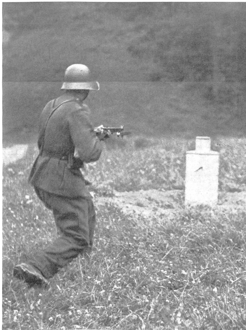
Der Fangschuß aus vollem Lauf. (Z.-Nr. VI SN 10584.) Il colpo di presa in piena corsa.

2. Stechen. Angewandt wird der mit voller Kraft geführte Kurzstoß in den Unterleib des Gegners, wo der Stich