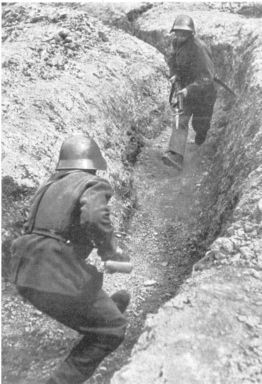
Der Schnappschuß im vollen Lauf. (Z.-Nr. VI SN 10585.) Un colpo improvviso in piena corsa.

Diese neuen Schießmethoden müssen aber auch dort Eingang finden, wo sie außer der Armee in erster Linie angewandt werden müssen. Wir meinen die Ortswehren und die bewaffneten Luftschutzeinheiten. Diese Verbände werden ausschließlich in coupiertem Gelände oder in Ortschaften (Straßenkämpfe) eingesetzt. Sie werden vor allem gegen einen Gegner eingesetzt, der ihnen punkto Bewaffnung und Ausbildung haushoch überlegen ist. Was in einem solchen Falle noch vom üblichen Schießen zu halten ist, kann sich jeder selbst ausmalen. Zu diesen Verbänden kommen noch die sog. Betriebswehren, die sich aus gleichem Material rekrutieren, wie Ortswehr und Luftschutz. Dort ist die Lage im Ernstfall wenn möglich noch gravierender. Wir hatten in den letzten Wochen Gelegenheit, mit den Männern einer Betriebswehr Schießausbildung im neuen Sinne zu betreiben. Obschon diese Betriebswehr seit Monaten aufgestellt ist, waren sowohl Schießausbildung wie Gewehrkenntnis unter aller Kritik. Diese Männern einem allfälligen Gegner gegenüberstellen, hieße, sie in einen nutzlosen Selbstmord treiben. Wir begannen unser Programm mit gründlicher Gewehrkenntnis, dann mit formeller Schießausbildung. Nach und nach wurden die Anforderungen systematisch gesteigert, um zuletzt in kleinen Uebungen auf Gegenseitigkeit ihren Höhepunkt zu finden. Die ganze Betriebswehr zählte zwölf Mann. Jeweils die Hälfte hatte den Feind zu