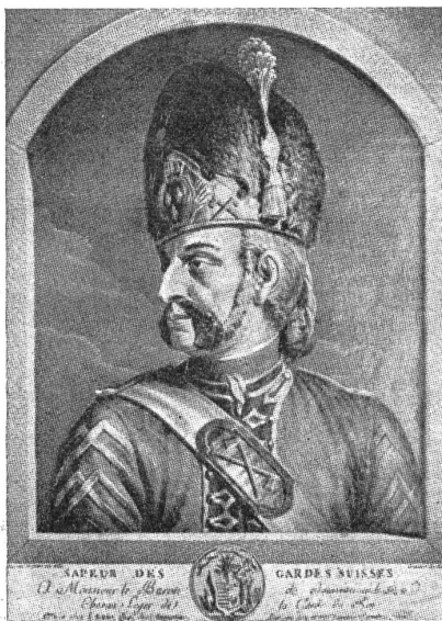
Sappeur des Schweizer Garderegimentes. Nach einem zeitgenössischen Stich. — Sappeur du régiment des gardes suisses, d'après une gravure de l'époque. — Zappatori del Reggimento di guardia svizzera.

Alle diese ungünstigen Momente vermochten die Haltung der Schweizergarde in keiner Weise zu beeinflussen. Weder Ueberredungsversuche noch Schmähungen und Beleidigungen machten die Schweizer schwankend in der Erfüllung ihrer soldatischen Pflicht. Sie harrten kaltblütig des Angriffs, sie verteidigten mit beispielloser Tapferkeit das Schloß, sie geleiteten den schwachen König durch die tobende Menge zur Nationalversammlung, wo er Schutz suchte, und sie legten auf seinen ausdrücklichen Befehl sogar die Waffen nieder, alles getreu dem geschworenen Soldateneid. Diese Treue zum Eid ist um so höher zu werten, als die Schweizer nicht für ihr Vaterland kämpften, sondern für einen fremden König, nicht Haus und Hof verteidigten, sondern