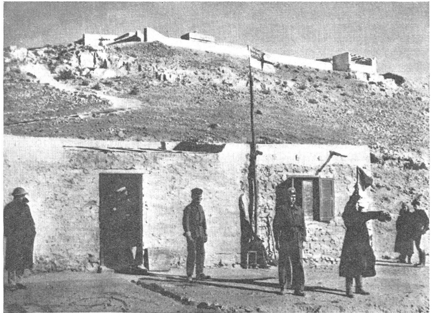
Die Zitadelle von Tobruk mit einer englischen Ufer-Signalstation.

Sinn und Bedeutung der Festungen und befestigten Zonen hat sich im Laufe der Kriegsgeschichte nicht geändert . Schild und Harnisch sind sie dem Verteidiger heute wie gestern. Sind sie so stark, daß kein Gegner seine Kraft an ihnen zu erproben wagt, so haben sie schon den wichtigsten Teil ihrer Aufgabe erfüllt. So ist es dem Westwall zu verdanken, daß im Herbst 1939 das deutsche Heer sich mit seinen Hauptkräften gegen Polen wenden konnte, ohne befürchten zu müssen, vom Westen her im Rücken gepackt zu werden. Greift der Gegner sie an, so haben sie bis zur Erschöpfung der Verteidigungsmöglichkeiten auszuhalten, es sei denn, daß ihnen die militärische Führung befiehlt, den Widerstand einzustellen, weil ein längeres Ausharren ohne Bedeutung für die Gesamtlage ist. Der Angreifer wird es mit dem Generalfeldmarschall von Moltke halten, der schon vor dem Deutsch-Französischen Kriege von 1870 schrieb: «Die Heere unserer Zeit bleiben nicht vor festen Plätzen stehen, an denen man vorbeirücken kann. Ihr eigentliches