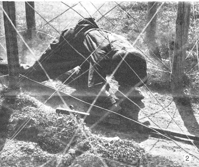
② Im Drahtverhau der Hindernisbahn. (VI Br 10831.)