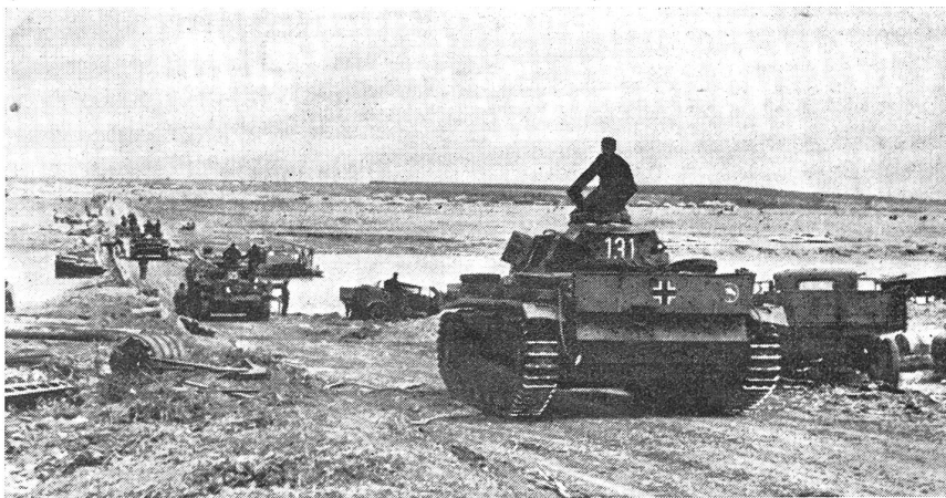
Panzergruppe im Vormarsch über den Don.

Kein Schuß fällt, während die Boote in rasendem Tempo den etwa 250 Meter breiten Don überqueren und knirschend auf den Ufersand auflaufen. Vor den deutschen Infanteristen liegt nunmehr ein Gelände, das ebenso ideal für den Verteidiger, wie ungünstig für