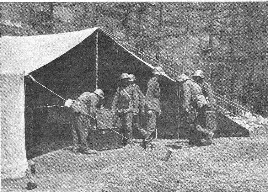
Einräumen der Materialkisten in das Verbindzelt einer Geb.San.Kp. (VI Br 10962.)

Gebirgsjäger sind für den Dienst im Hochgebirge, in Fels und Eis, besonders bekleidet und ausgerüstet. Sie tragen eine Bluse von bequemem Schnitt, eine schicke Mütze, lederbesetzte Hosen, nagelbesetzte Bergschuhe und Wickelgamaschen, sie führen mit sich Bergstöcke, Seile, Mauerhaken und andere alpine Ausrüstungsstücke. Ihre schweren Waffen (Geschütze, Maschinengewehre, Granatwerfer) sind — z. T. in mehrere Lasten zerlegt — Tragtieren, Kleinpferden (Tiroler Haflinger) und Maultieren aufgebürdet. Ihre Friedensstandorte liegen in den Alpenländern. Ihr Ersatz stammt zum überwiegenden Teil aus