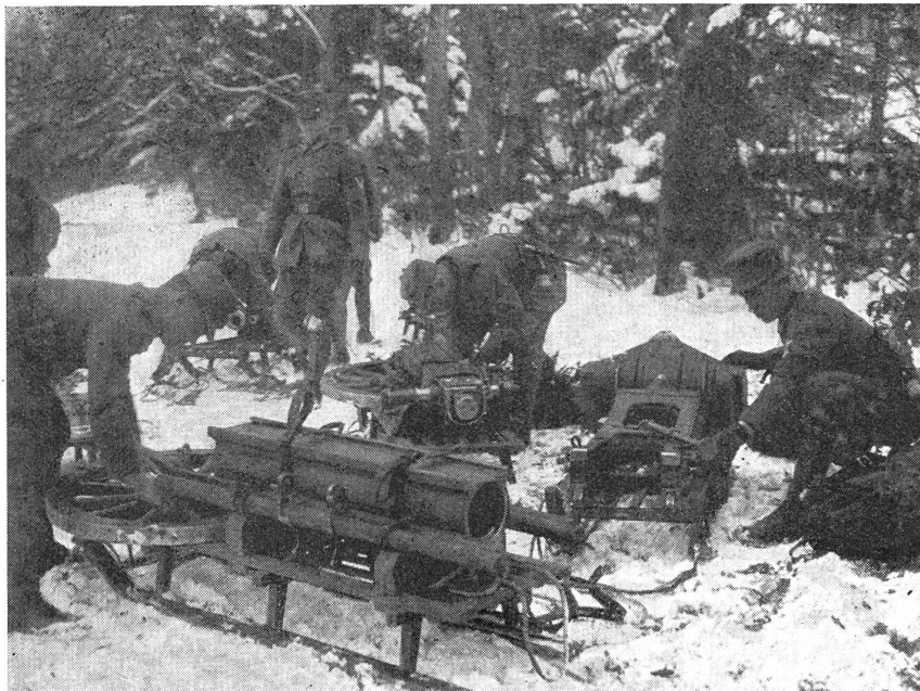
Deutsche Gebirgsjäger beim Verladen eines zerlegten Geschützes auf Transportschlitten.

Ihre getreuesten Helfer, die Tragtiere, sind zähe, wetterharte, trittsichere, genügsame Geschöpfe, die mit ein