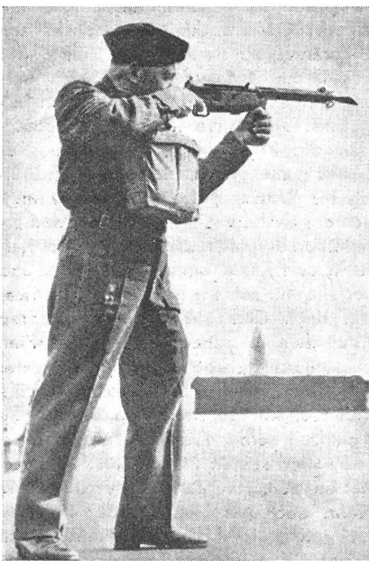
Die neue englische «Sten»-Maschinenpistole wird zum Feuern in den Achselanschlag genommen.