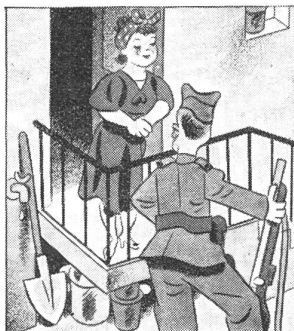
Die beiden kennen sich noch nicht lang — aber es hat doch einen ausführlichen Abschied gegeben, als er einrückte.

Der bekannte Luftfachverständige Peter Masefeld äußerte sich im «Spectator» vom 25. September wie folgt über den Luftkrieg: «Beim letzten Großangriff auf London am 1. Mai 1941 kamen insgesamt 400 deutsche Flugzeuge zum Einsatz, die knapp über 420 Tonnen Bomben abwarfen. Bei jedem ihrer «mittelgroßen» Angriffe, die von rund 200 Flugzeugen durchgeführt werden, führt die R.A.F. heute mehr als 450 Tonnen Spreng- und Brandbomben mit sich, dabei in letzter Zeit häufig Sprengbomben im Gewicht von 4000 und 8000 lbs. Dieser Unterschied ist darauf zurückzuführen, daß die großen englischen Bomber zwischen 13,000 und 17,000 lbs (6 bis 8 Tonnen) Nutzlast mitnehmen können, während der schwerste deutsche