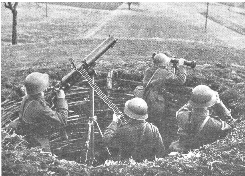
In der Verteidigung und bei ortsfester Flab werden sich auch die infanteristischen Fliegerabwehrwaffen zum Schutze gegen Splitterwirkung einzugraben haben, ohne daß dadurch Beweglichkeit der Waffe und Schußfreiheit beschränkt werden dürfen.

Die großen Zielgeschwindigkeiten moderner Flugzeuge ergeben für die einzelne Waffe relativ geringe Trefferwahrscheinlichkeit. Nur eine größere Anzahl von Treffern läßt erwarten, daß die Besatzung vernichtet oder wichtige