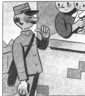
„Haben Sie nicht Angst vor Ansteckung?“ fragt sie, „Sie haben doch einen schweren Beruf.“