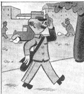
Der Briefträger ist gut Freund mit seinem ganzen Bezirk; er kennt alle und alle kennen ihn.

Im Keller des Kompanieführers sitzen die zwei Unteroffiziere, um sich ein wenig aufzuwärmen; denn draußen sind schon wieder 15 Grad Kälte, und Ruhe gibt es für sie ja nicht. Sie sind heute beide verwundet worden, der eine durch einen Splitter im linken Unterarm, der andere durch einen herabstürzenden Ziegelstein am Hals. Es sind leichte Verwundungen, aber immerhin so, daß beide zurück zum