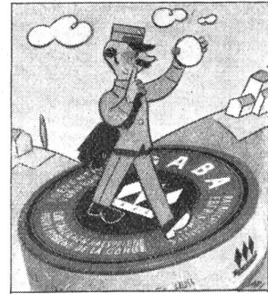
„Oh, ich habe immer eine Schachtel Gaba bei mir; Sie sollten auch Gaba im Haus haben, gerade in dieser Jahreszeit, denn Gaba beugt vor.“