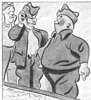
— „Das kommt vom lockeren Stroh. Der Staub fliegt Dir in die Nase. Mir macht es nichts mehr aus.“