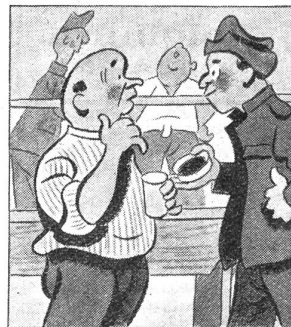
„Heiser bin ich auch. Ist wirklich der Staub dran schuld?“ — „Da nimm lieber ein paar Gaba, die lasse ich mir immer schicken.“