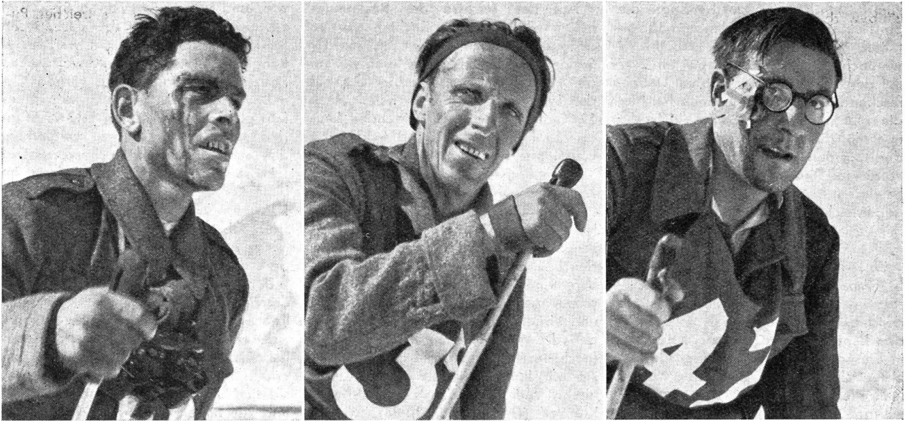
Drei von Dreizehnhundert. Schnappschüsse aus dem Patrouillenlauf. Verbissen werden die letzten Streckenkilometer in Angriff genommen. Was tut's, wenn man aus einer Wunde blutet? Die Aufgabe soll erfüllt werden! (Zensur-Nr. VI S 12204/6.)