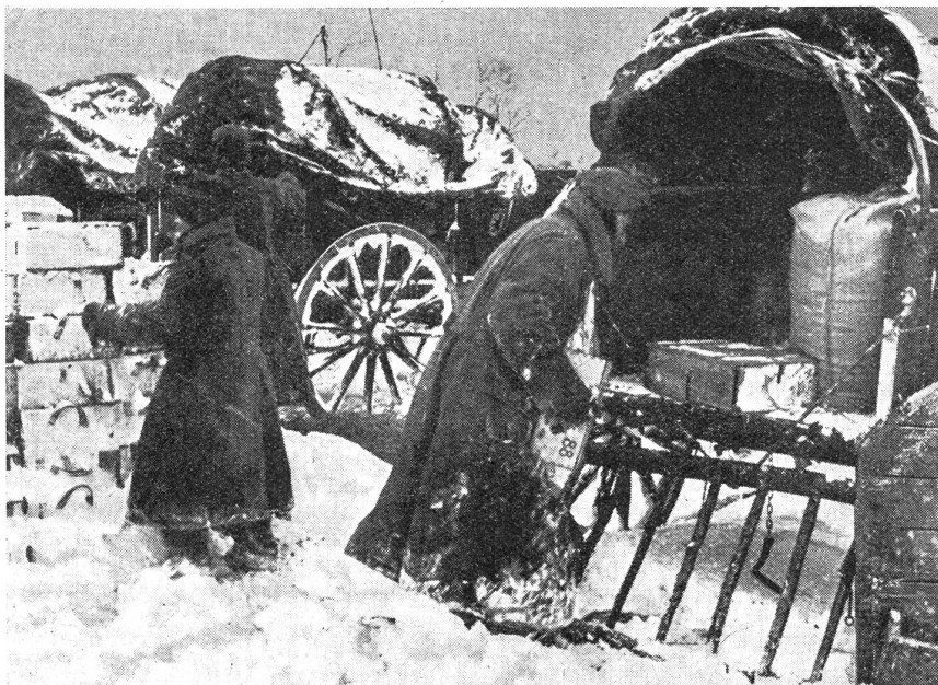
Fassungsplatz an der winterlichen Ostfront.

Diese Uebersicht skizziert nur in groben Umrissen die ebenso vielfältige wie schwierige Aufgabe, vor die der Nachschub- und Versorgungsapparat einer Panzerarmee täglich neu gestellt ist. Das Wort «unmöglich» hat auch hier keine Existenzberechtigung. Der vergangene Winter hat es bewiesen. Nur durch den unermüdlichen Einsatz jedes Soldaten konnte die Front gehalten und versorgt werden. Die bevorstehenden Aufgaben sind nicht geringer. Mit jedem neuen Kilometer, der dem Feind abgerungen wird, vergrößert sich der Nachschubweg. Aber ebenso selbstverständlich wie der Soldat an der Front seinen harten Dienst erfüllt, schaffen seine Kameraden der