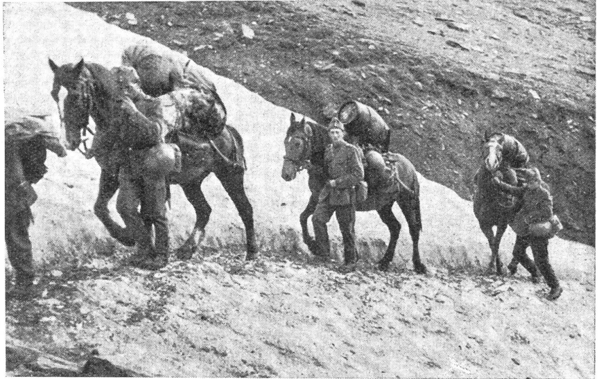
Wege des Nachschubes: in einem heimatlichen Gebirgsabschnitt, (Z.-Nr. VI S 3736.)

Immer wieder sahen wir bewegungsunfähige Lastzüge bis an die Achsen im Schlamm versunken stehen und ihre Fahrer sich schweißtriefend bemühen, sie wieder freizubekommen. Immer wieder sahen wir sie wie in einem Moorbad unter dem Wagen liegen und Reparaturen ausführen, Reifen wechseln, Motorschäden beheben, Federn verstärken. Immer wieder sahen wir sie sich aufs neue an das Steuerrad schwingen und abermals starten. Und immer wieder sahen wir die Kolonnen rollen, rollen bei Tag und bei Nacht, obgleich sie mehr rutschten als fahren, rollen über Stoppelfelder und Wegestrecken, die Mondlandschaften gleichen, so waren sie durchwühlt und aufgerissen. Aber sie rollten. Die Rollbahn nach vorn. Bepackt mit Material. Hochbeladen mit Benzinfässern. Den letzten Winkel des Laderaumes mit Konserven und Brot vollgestaut. Ob sie hundertmal liegen blieben — sie starteten hundertmal wieder. Ob sie wie Segelschiffe in schwerer Dünung stampften, sie bissen sich durch Schlaglöcher und