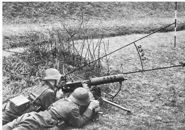
Photographie Nr. 4: Zens.-Nr. IX b B 3098. Der Festlegepunkt.

Schweiz. Armee: Anleitung für das indirekte Maschinengewehrschießen 1937. Hptm. Gallusser: Indirektes Schießen mit dem Maschinengewehr (Schweiz. Unteroffiziersverband). Curti: Automatische Waffen. Von einem Minenwerferoffizier: Das indirekte Richten der Minenwerfer. Schweiz. Armee: Technisches Reglement Nr. 12, «Meß- und Beobachtungsinstrumente der Infanterie» (Handhabung des Sitometers, Kartenwinkelmessers, Richtkreises, Meßdreiecks, Feldstechers, Telemeters, Barometers, Thermometers usw.).