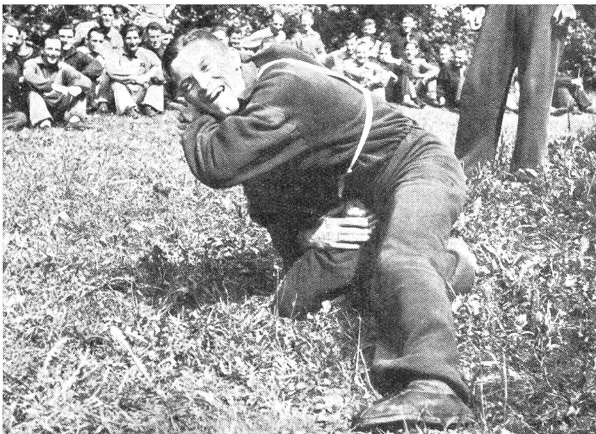
Eine neue Art des Ringkampfes. Die beiden Gegner tragen auf den Schultern Nummern wie die Skiwettkämpfer. Sie greifen an, und wer dem andern durch List oder Behendigkeit die Zahl ablesen kann, hat den Kampf gewonnen. (Zensur-Nr. N.V. 12115.)

Wichtigstes Prinzip der Leiterkurse ist das beispielhafte Vorangehen, das