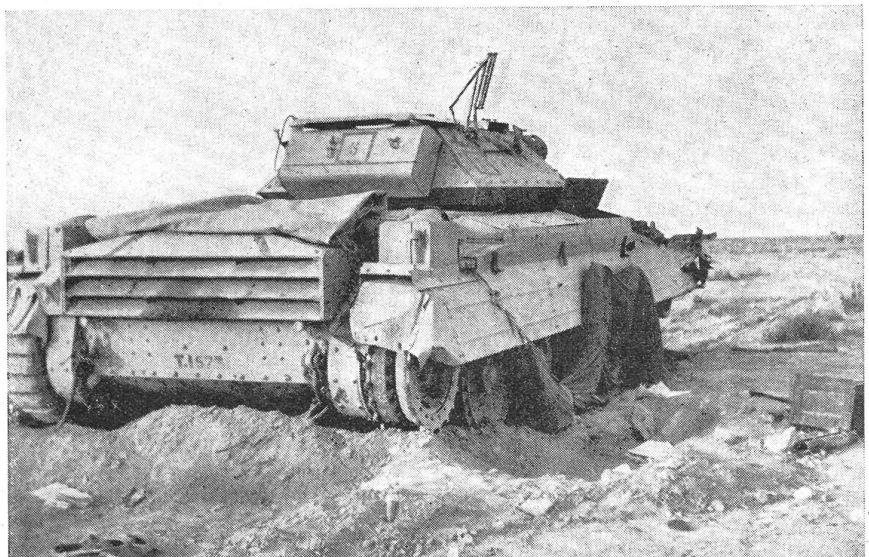
Unter der Feindwirkung liegen geblieben, aber noch reparaturfähig.

Ein wichtiges Aufgabengebiet der R.E.M.E. bildet die Instandhaltung der Funkgeräte, resp. deren Ausbesserung bei Schäden. Auch hier unterscheidet sich der Arbeitsgang kaum wesentlich