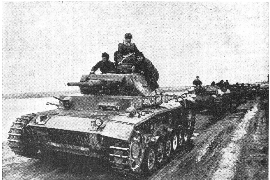
Erbeutete und wieder instand gestellte Feindpanzer auf der Fahrt zur Kampffront.

Wenn bisher nur die zahlreichen und weitgesteckten Aufgaben dieses jungen Korps erwähnt wurden, so sollen nun noch zwei Beispiele zeigen, wie ela-