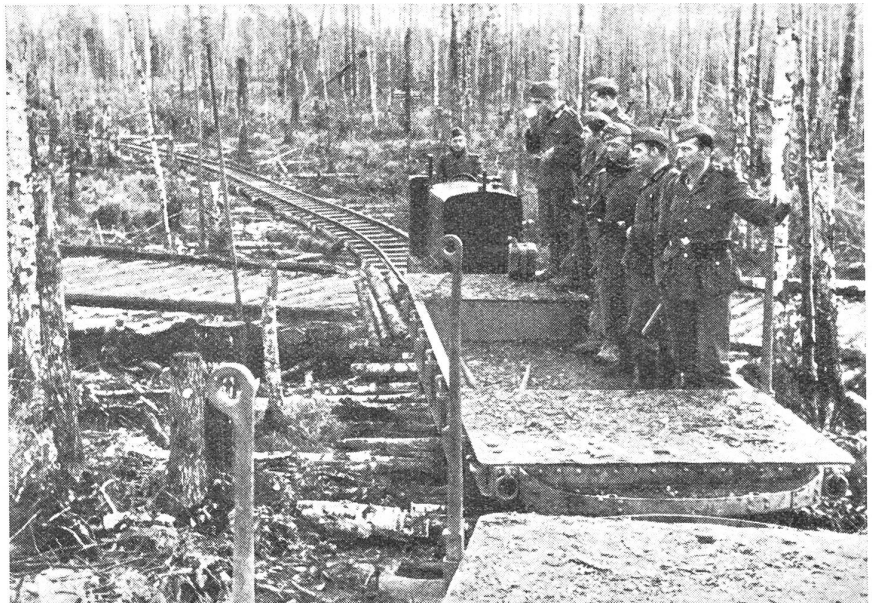
Die Schmalspurbahn im Wolchow-Kampfgebiet.

Die einzelnen Partisanenabteilungen sind gewissermaßen Unterseebooten vergleichbar, die weit in feindliches Gebiet vorstoßen, um den Gegner zu schädigen, wo sich dafür Gelegenheit bietet. Die Partisanen vernichten feindliche Kommandoposten, Munitionsdepots, Mannschaftsunterkünfte, Lebensmittelmagazine, sie unterbrechen Bahnlinien und verminen nachschubwichtige Straßen, greifen feindliche Truppenteile auf dem Marsch und während der Ruhe an oder weisen sie in falsche Richtungen, sie zerstören Bahnhöfe, Geschützparcs, Panzerwerkstätten — kurz, sie fügen dem Feind ein Maximum an Schaden zu, wo sie nur können. Das Gesetz der Fairness und Ritterlichkeit hat für den absolut soldatischen Partisanenkämpfer keine Geltung, um so mehr, als er genau weiß, daß sein Gegner ebenfalls nicht geneigt ist, dies ihm gegenüber gelten zu lassen, sondern ihn rasch und ohne Prozeß mit Kugel oder Strang tötet. Deshalb geben Partisanen keinen Pardon, aber er-