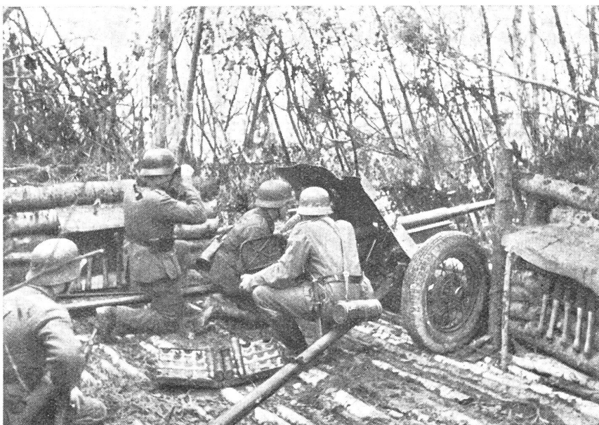
Selbst für die verhältnismäßig leichten Plak-Geschütze mußten im Wolchow-Gebiet Knüppelplattformen erstellt werden.

nigermaßen zuverlässiger Verbindungsweg sind.