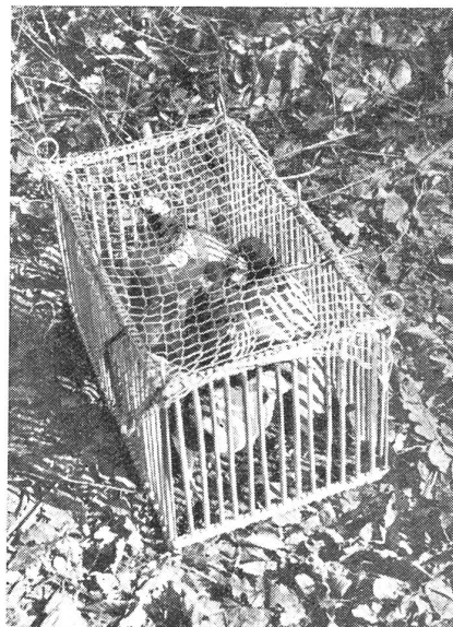
Brieftauben im Ruhekäfig der Abgangstation. (Zens.-Nr. A/N/099.)

Wenn nun heute die Brieftaube wieder Verwendung findet in der Kombination der Nachrichtenmittel, so ist es, um auch alle Eventualitäten zu berücksichtigen, welche die normale Entwicklung oft kaum vermuten läßt.