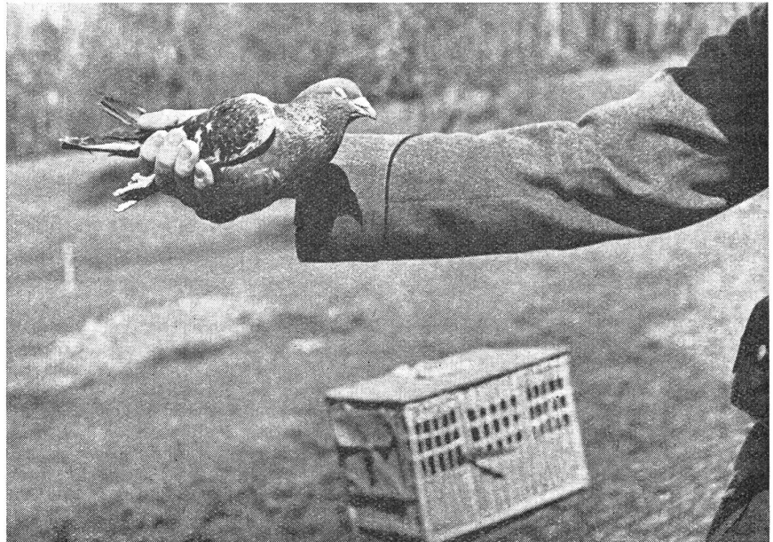
Richtige Haltung der Brieftauben beim Abflug. (Zens.-Nr. A/N/088.)

«Le principal inconvénient de l'emploi des pigeons voyageurs réside