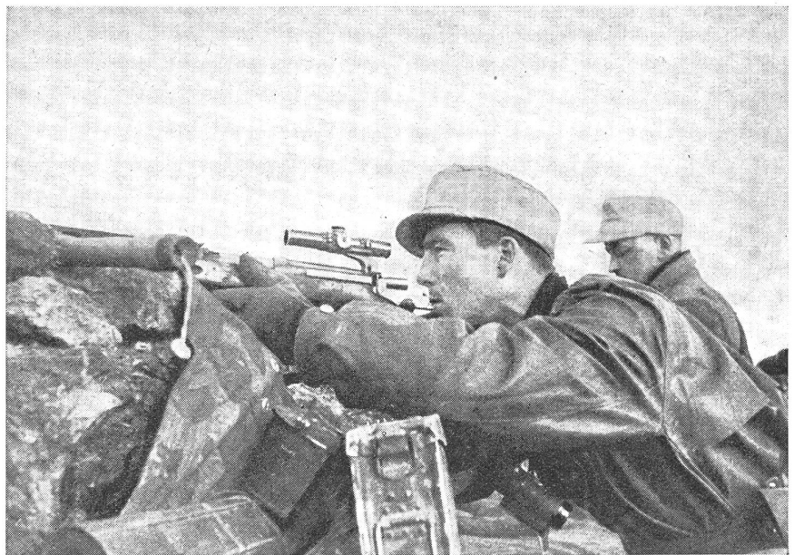
Grabenbeobachtungsposten mit aufgestecktem Zielfernrohr auf dem Gewehr.

erfahrungen nimmt es sich jetzt im Kriege der Scharfschützenausbildung mit erhöhtem Nachdruck an. Es kommen dafür Schützen in Frage, die während der grundlegenden Schießausbildung und im Fronteinsatz bewiesen haben, daß sie über ein außergewöhnlich scharfes Auge und eine feste Hand, über ein gutes Beobachtungsvermögen, kaltes Blut und hohe Einsatzbereitschaft verfügen. Das Heer gibt ihnen die bestschießenden Gewehre, Waffen mit aus-