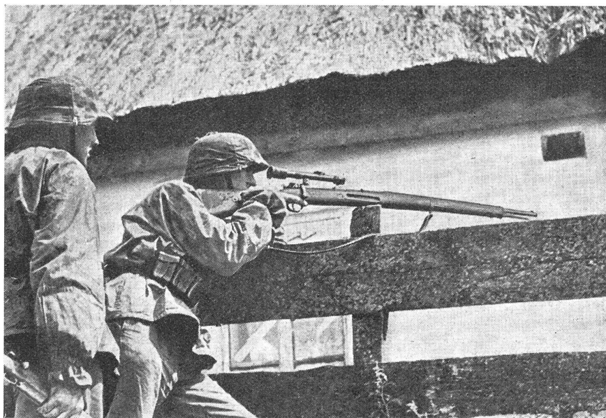
Deutscher SS-Scharfschütze im Ortskampf.

dem überraschten Gegner auf günstigste Entfernung mit dem ersten Schuß den Garaus zu machen. Nicht minder wichtig ist es aber auch, daß er lernt, «fakirgleich», wohlgetarnt in Anschlagbereitschaft stundenlang abzuwarten, bis ein lohnendes Ziel in seinem Blickfeld auftaucht.